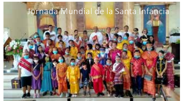
Jornada Mundial de la Santa Infancia