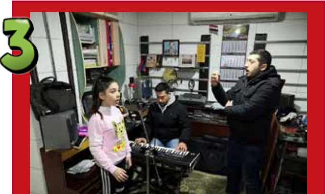
3 El período de formación de los candidatos seleccionados tuvo lugar del 1 al 11 de febrero y aprendieron las canciones que luego cantarían en público frente al jurado.