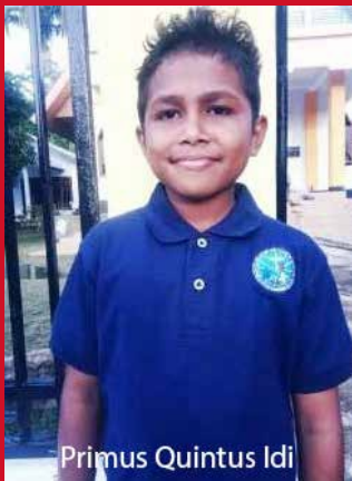
Primus Quintus Idi

Durante la celebración del aniversario de la Santa Infancia, respetamos los protocolos sanitarios. Como amiguitos de Jesús, debemos dar ejemplo a otros amigos para que podamos deshacernos de la pandemia en curso. Esta pandemia nos ha enseñado a los pequeños amigos de Jesús a apreciar más el tiempo que pasamos juntos y a cuidar de los demás. Espero que todos nosotros durante esta pandemia siempre estemos agradecidos con el Señor no obstante todo lo que estamos enfrentando y oremos para que esta pandemia de Covid-19 pase rápido en modo que todos podamos reunirnos nuevamente el próximo año para las actividades por el 179 aniversario de la Santa Infancia, sin miedo y sin angustia.