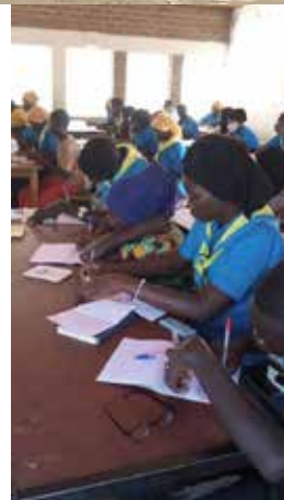
Grupo de coordinación de la Diócesis de Pala

Infancia Misionera pudo realizarse sin problemas particulares, aunque persisten las consecuencias de la pandemia.