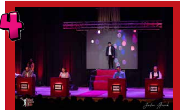
4 El primer espectáculo tuvo lugar el 12 de febrero de 2021. De los 27 asistentes, solo 19 fueron elegidos para el segundo show.