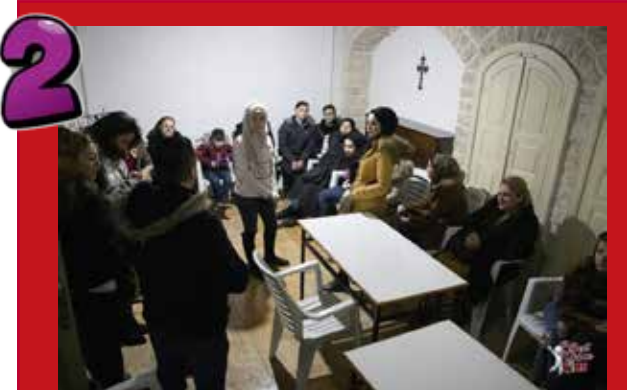
2 28 de enero de 2021: primera audición. De 72 nominados, 27 fueron elegidos para asistir al espectáculo en vivo.