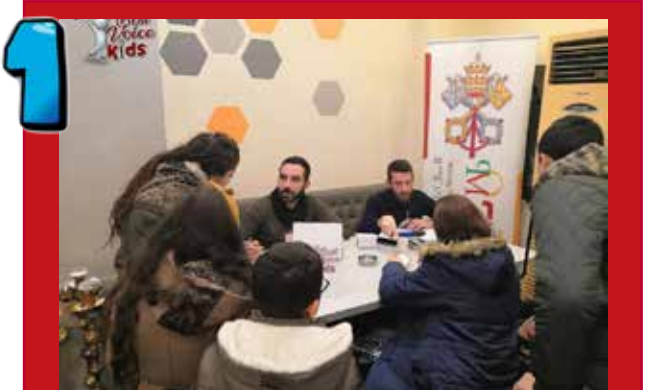
1 El envío de solicitudes estuvo abierto del 18 al 22 de enero de 2021.